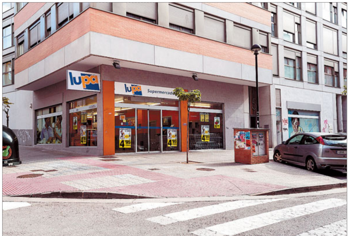
Uno de los establecimientos al que acudieron las ladronas, en la calle Trespaderne.

Se trataría de un simple hurto si no fuera porque se enfrentan a todo aquel que se interpone en su camino. A los clientes que tratan de disuadirlas de su acción los amenazan de muerte e incluso se enzarzan en peleas que acaban de mala manera. Con las cajeras sucede lo mismo, incluso las tiran de los pelos si intentan impedirles el paso.