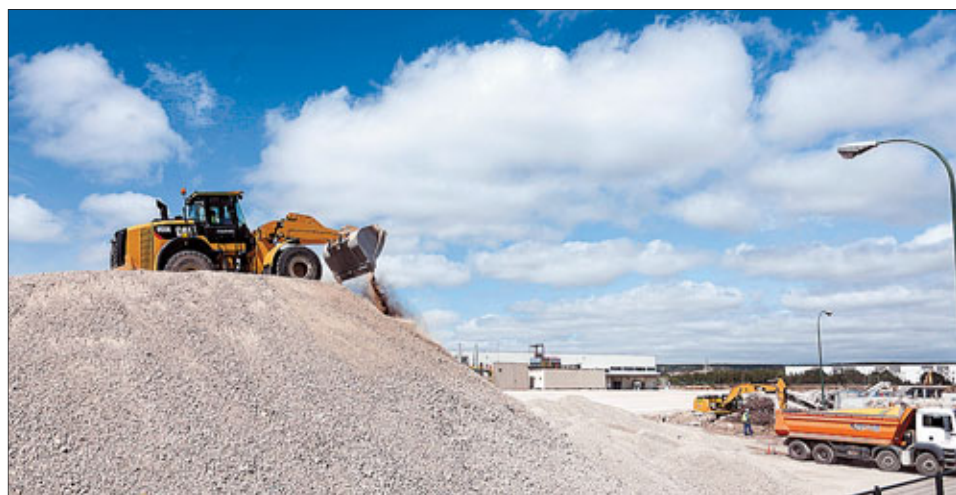
El escombros de la vieja fábrica se ha transformado en hormigón para ser reutilizado. / PATRICIA