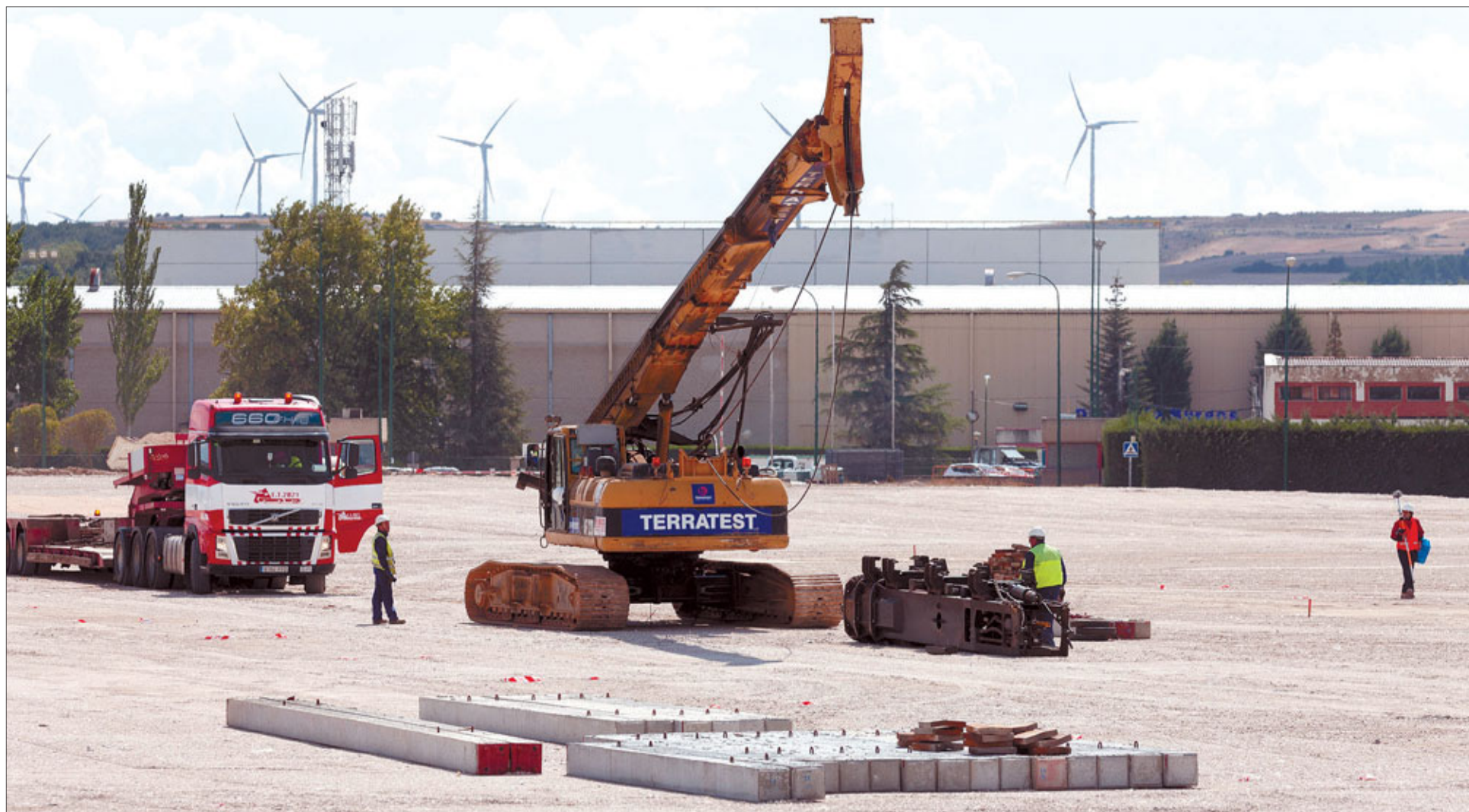
Un camión descargó la máquina percutora junto a los pilotes en el lugar donde se construirá la futura factoría de la cárnica.