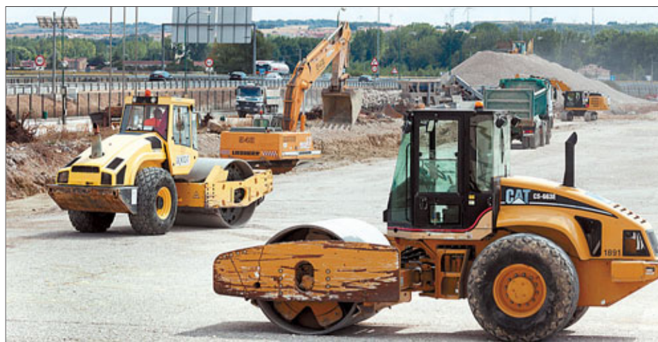
Las máquinas trabajan en terminar de nivelar la plataforma.